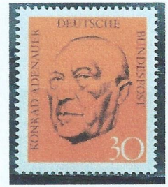
Konrad Adenauer (1876-1967)

1952 kam es zu einem offizieller Briefwechsel zwischen Bundespräsident Theodor Heuss und Bundeskanzler Konrad Adenauer und man entschied, dass Das Lied der Deutschen die Nationalhymne blieb, zu offiziellen Anlässen jedoch nur die dritte Strophe gesungen werden sollte.