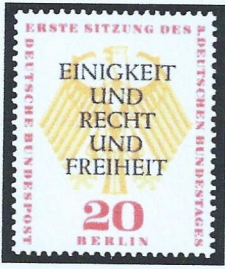
... für das deutsche Vaterland

Einigkeit und Recht und Freiheit für das deutsche Vaterland! Danach lasst uns alle streben brüderlich mit Herz und Hand! Einigkeit und Recht und Freiheit sind des Glückes Unterpfand: |: Blüh im Glanze dieses Glückes, blühe, deutsches Vaterland! :|