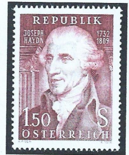
Joseph Haydn (1732-1809)

Der Dichter schuf sein Werk ausdrücklich zur Melodie des älteren Liedes Gott erhalte Franz, den Kaiser von Joseph Haydn (1797).