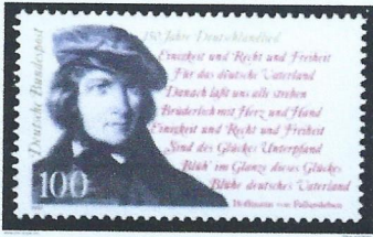
Hoffmann von Fallersleben

Das Lied der Deutschen, auch Deutschlandlied genannt, wurde von August Heinrich Hoffmann von Fallersleben am 26. August 1841 auf Helgoland gedichtet. Seine dritte Strophe ist der Text der deutschen Nationalhymne.