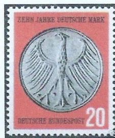
Wappenseite eines 5-DM-Stücks

Nach dem Zweiten Weltkrieg fanden Freiheit auf deutschen 2- und 5-Mark- 2-Euro-Stücke besitzen ebenfalls diese