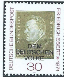
Friedrich Ebert (1871-1925)

Einigkeit und Recht und Freiheit für das deutsche Vaterland! Danach lasst uns alle streben brüderlich mit Herz und Hand! Einigkeit und Recht und Freiheit sind des Glückes Unterpfand: |: Blüh im Glanze dieses Glückes, blühe, deutsches Vaterland! :|