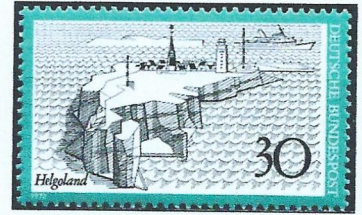
Helgoland, der „Geburtsort“ des Liedes

Das Lied der Deutschen, auch Deutschlandlied genannt, wurde von August Heinrich Hoffmann von Fallersleben am 26. August 1841 auf Helgoland gedichtet. Seine dritte Strophe ist der Text der deutschen Nationalhymne.